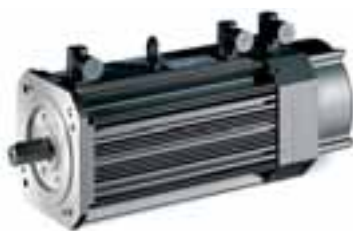
MCA 17N ... F17