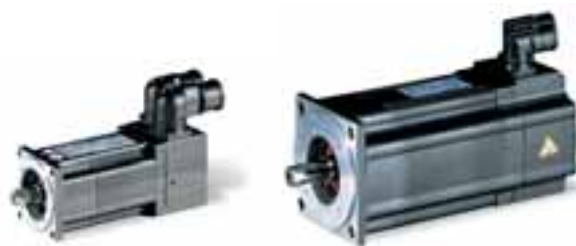
Серводвигатель MCS 14P со статором SEpT