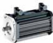
MCA 13I... 5