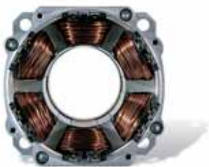
статор SEpT в серводвигателе MCS